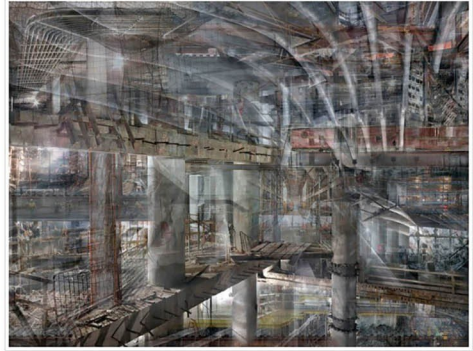
שי קרמר, מרכז הסחר העולמי #5

בין המציגים בתערוכה גם עברי לידר, עם התערוכה "Daddy" שמכילה זיכרונות מפורקים מאביו, שהיה צייר. אל הצילום הגיע רק בשנים האחרונות, לאחר קריירה משגשגת על הבמה. לידר מציג מיצב ובו חורי הצצה אל דימויים קטועים שצילם בדירת אביו, זיכרונות נמוגים. הוא מספר כי על הבמה הוא חש שליטה ובטחון ואילו הצילום הוא מקום הספק, אי הידיעה כיצד היצירה תפגוש את הקהל, אשר צופה בה ללא תיווך.