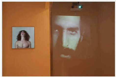
מבט אל התערוכה "תאי מדורה" שאצרה סג'ילית לנדאו.

אחת התערוכות המפתיעות בתערוכה נאצרה על ידי סג'ילית לנדאו ומוצגת בתיאטרון הלבשה בקצה האולם. בכל תא יש עבודת וידאו, והמראות שלא הסור מהתאים נותנות לעבודות רד נוסף.