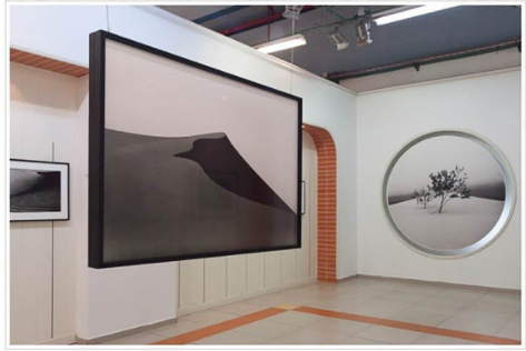
בתערוכה של ג'ון ספר.

בין תערוכות הצילום נמצא גם את התערוכה היפה של ג'ון ספר, צלם איטלקי ששייך למסורת הצילום הפיקטוריאלי. ספר מציל מדבריות במקומות שונים בעולם וגם אצלנו בנגב. הוא מציל במצלמת לייקה אנלוגית וגם מדפיס את הצילומים באופן אנלוגי – סגנון שהולך ונעלם ונותן אופי חומרי ייחודי לצילומיו, גרעיניות הפילים בו משתמש מהדהדת בגרגרי החול בדינות המצלמות.