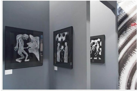
מבט אל התערוכה "רוחות נשמות" של רוג'ר באן.