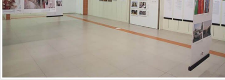
מבט אל כמה מהפרוייקטים החברתיים של הפסטיבל.

קשה לסכם במאמר אחד את העושר הרב שמביאים לפסטיבל 250 צלמים ואמנים. על כל אמן שהזכרתי יש גם אחרים וראויים. יש גם תערוכות שהיו פחות מעניינות בעיני – למשל תערוכת האוסף של "תמונות יפות" נדמית כמו שיטוט אקראי באתר משיגול גאוגרפי או באינסטגרם. חסרו לי תערוכות צילום מעניינות וחדשות, של אמנים ישראלים ובינלאומיים שלא נחלזו לקטגוריה של הצילום התישני. שכן כאלה היו, יפות, ובשפע. קטלוג התערוכה מספק מידע מנוגזם על כל תערוכה, הייתי שמחה לנצוא בו את הטקסט המלא ולעין בו בנחת בבית. חודה נספת בקטלוג, הוא מדוע אינו מסודר לפי מספור התערוכות, מה שנקשה מאוד מציאת מידע על כל תערוכה. גם האתר היפה של הפסטיבל אינו משלים את החסר במידע נוסף.